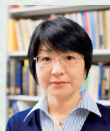
橋野知子 問題提起 神戸大学大学院経済学研究科教授